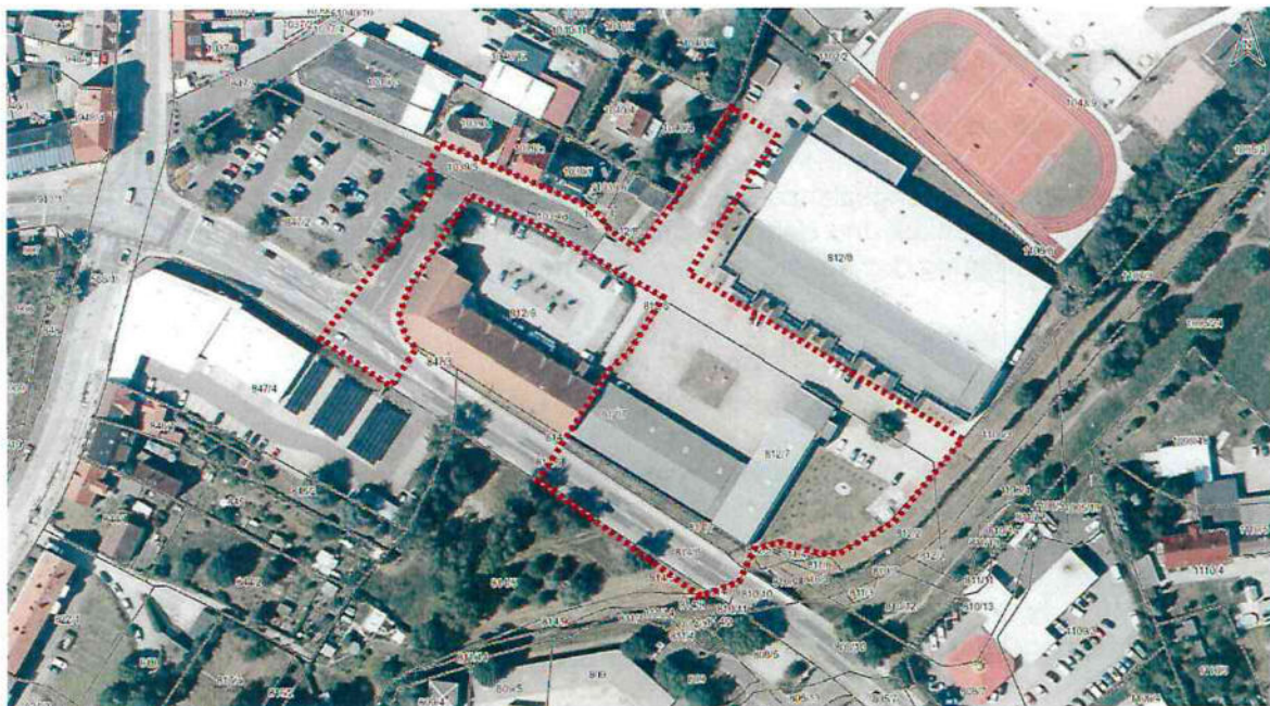
Luftbild mit Geltungsbereich des Bebauungsplanes

Die Fläche des Geltungsbereichs des Bebauungsplanes beträgt ca. 1,03 ha.